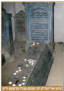
צינו של הגה"ק רבי מנחם מנדל מדעש ז"ע

(מקור: עובדא דאהרן פרק ו'. וראה בספר החת"ס ותלמידיו עמו"ש כ"ז, שריבנו החת"ס ביקש מתלמידו רבי מנחם מנדל פאנעט לטיל עמו כל ערב שבת כעשרה רגעים, והיה קורא לו בחביבות "דער זיידענער בחור" על שם בגדי המשי שהיה לובש בשבת כמנהג בנן של קדושים מעדת החסידים. מה שלא היה מראה נפוץ בישיבת החת"ס. וראה באגר"ס מכתב ע"ד מובא אגרת שכתב אביו בעל המראה יחזקאל ז"ע לחת"ס, בו מודה לו על שמקומו לבנו רבי מנחם מנדל ביתר שאת)